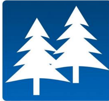
2. Hyvin kasvava metsä